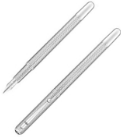
Đ ĨƒĨ†Đ°Đ° Đ¿ĐμĨ€ĨƒĐμĐ²Đ°Ĩ• Dunhill streamliner 22 219.00 ĩ€ĨƒĐ±