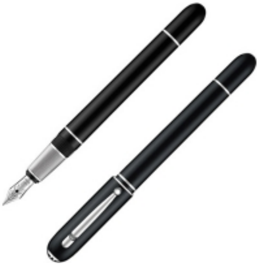
Dunhill sidecar black 17 443.00 €