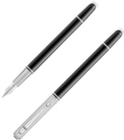
Đ ĨƒĨ†Đ°Đ° Đ¿ĐμĨ€ĨƒĐμĐ²Đ°Ĩ• Dunhill Streamliner chassis 24 161.00 ĩ€ĨƒĐ±