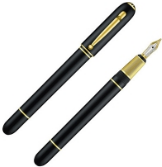
Dunhill sidecar black 17 443.00 €